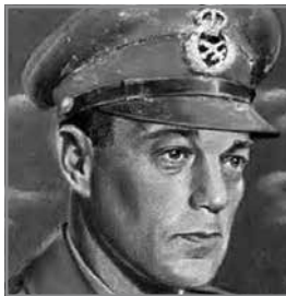
Sir Robert Laycock

Fil-bidu kien gie deċiż li l-25 Anniversarju tal-Każin Imperial jiġi ċelebrat nhar it-28 ta' Awwissu 1955, imma din id-data giet mibdula aktar tard għat-18 ta' Settembru 1955. Giet imwaqqfa kummissjoni ta' erba' membri, inkluz is-Surmast tal-Banda, biex torganizza dan l-avveniment u biex thejji programm għall-Banda. Għal din l-okkażjoni gie deċiż li jiġu mistiedna l-Eċċellenza Tiegħu l-Gvernatur Sir Robert Laycock, l-Arcisqof Mikiel Gonzi, il-Prim Ministru Dom Mintoff u persuni prominenti oħra. Għal din l-okkażjoni gie kummissjonat ukoll Stendard Malti bil-George Cross fih u dan kien se jsir għand is-Sorijiet tal-Qalb ta' Ġesù tal-Mellieħa.