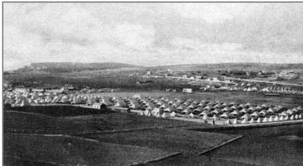
Il-Kamp ta' Għajn Tuffieħa fl-Ewwel Gwerra Dinjija

Dan il-post jaf l-origini tiegħu mill-1902 'il quddiem fejn l-Ammiraljat kien ħa numru ta' art agrikola mingħand il-bdiewa biex inbena kamp ta-taħriġ għall-morini. Dan kien jikkonsisti f' ranges tal-isparar u kwartier residenzjali għas-soldati, il-familji tagħhom u l-uffiċjali tal-kamp.