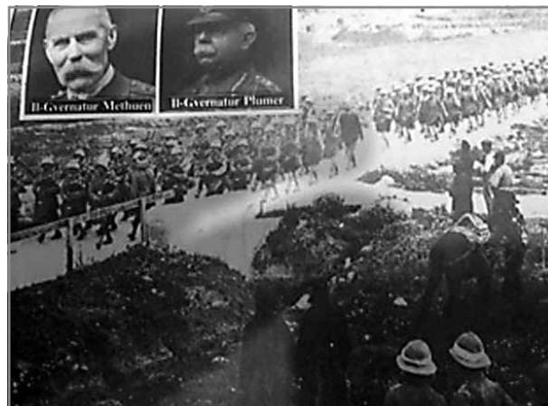
Soldati mis-Sutherland and Argyll Highlanders jieħdu sehem f'manuvri qrib il-Bajja tal-Għadira, ftit żmien qabel il-Gwerra tal-1914-1918. Fl-isfond jidhru ritratti tal-Gvernturi Methuen (1915-1919) u Plumer (1919-1924)

sistema ma taħdimx u fl-1907 reġgħet saret priorità l-ħarsien tax-xtajtiet tat-tramuntana u bdiet ħidma biex tinbena sistema ġdida ta' trunċieri u kanuni magħrufa aħjar bħala ridge defences . Dan fl-inħawi tagħna saru l-aktar fuq l-għoljiet tal-Mellieħa fuq ir-riħ tal-bajja tal-Għadira 37 .