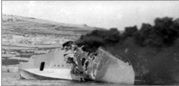
Is-Sunderland L2164 jaqbad, fejn anki nqaghlet u waqgħet il-gwejnha tax-xellug.

Tuffieħa probabbilment ittieħed matul dawn is-snin. 8 Il- Flight inbidlet fi skwadra f'Jannar 1929 u b'hekk saret tissejjaħ No.202 Squadron tal-RAF. F'Lulju 1932 l-iskwadra rċiviet l-ewwel Fairey III F.Mk.3M. Kif jindika dan ir-ritratt tal-Fairey III F.Mk.3 meħud fil-Bajja tal-Mistra, probabbilment ittieħed fil-bidu tas-snin tletin. 9