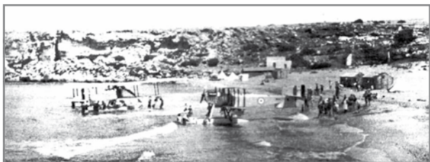
Ajruplani tal-baħar tat-tip Fairey IIIDs fil-Bajja ta' Għajn Tuffieħa.

Matul l-aħħar sena tal-Ewwel Gwerra Dinjija, numru ta' ajruplani tal-baħar tar-Royal Air Force (RAF) ġew trasferiti f'Malta biex jgħinu fil-gwerra kontra l-U-boote (Sottomarini Germanizi) tal-Kaiserliche Marine, li kienu jhufu f'ibħra Maltin. Dawn l-ajruplani tal-baħar kienu stazzjonati f'Kalafrana. Wara tmiem l-Ewwel Gwerra Dinjija dawn l-ajruplani komplew joperaw minn Kalafrana għal għanijiet varji, bħal pereżempju kooperazzjoni mar-Royal Navy (RN). Però l-ajruplani tal-baħar li kien hawn Malta kienu joperaw biss minn Kalafrana. 1 Żewġ bajjiet minnhom jinsabu fil-Melleħa li huma l-Bajja tal-Mistra 2 u l-Bajja ta' Għajn Tuffieħa. 3