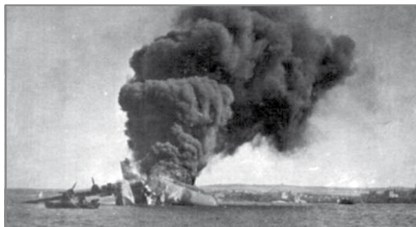
Tliet ijiem wara l-Messerschmitts rritornaw fejn din id-darba mmaxingjaw Sunderland L2164 u spicċa jaqbad.

Fil-bidu tas-snin għoxrin, l-iskwadra kienet għadha magħrufa bħala n-No. 481 Flight tal-Fleet Air Arm. Hija waslet f'Malta fl-1923 u kienet stazzjonata fil-Bajja ta' Kalafrana fejn użat Fairey IIIDs bejn is-snin għoxrin u s-snin tletin, sakemm ġew mibdula mill-Fairey IIIF.Mk3Ms. 7 Għalhekk, ir-ritratt li juri Fairey IIIDs fil-Bajja ta' Għajn