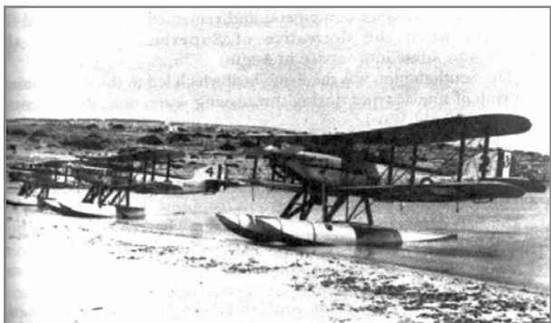
Ajruplani tal-baħar tat-tip Fairey IIIDs fil-Bajja tal-Mistra.

Tipi partikulari ta' ajruplani tal-baħar li kienu jsorġu f'dawn iż-żewġ bajjiet kienu tat-tip Fairey IIIDs u l-verżjoni iktar avvanzata tat-tip Fairey IIIF Mk.3Ms tan-No.202 Squadron. Jeżistu żewġ ritratti ta' ajruplani tat-tip Fairey IIIDs tal-istess skwadra msemmija fil-Bajja ta' Għajn Tuffieħa u r-ritratt l-ieħor tat-tip Fairey Mk.3Ms fil-Bajja tal-Mistra. 4