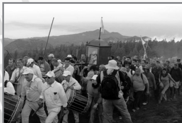
L-istatwa akkumpanjata mid-daqqaqa

Il-purċissjoni, fil-fatt hi maqsuma f'seba' mixġiet, imsejha "rayas". F'kull waħda minnhom ix-