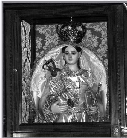
Il-Vergni tat-Tre Re

Meta konna ferm iktar żgħażaġħ, konna nidħku b'dan il-ħsieb, però wara li aħna kellna x-xorti li nżuru din il-gżira, rajna għaliex kienu jaħsbu hekk. Nistqarru li f'moħħna għaddew l-istess ħsibijiet;