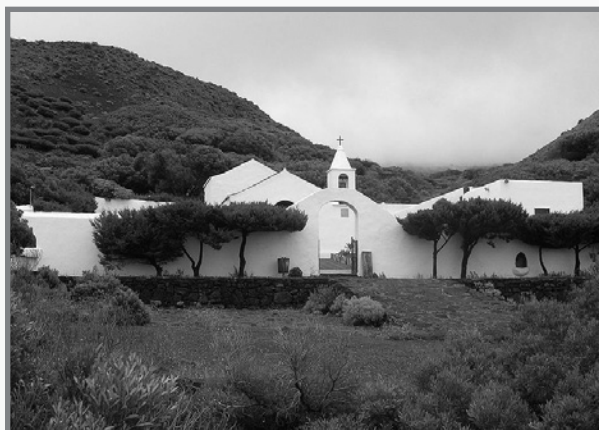
Is-santwarju tal-Eremita tal-Verġen de los Reyes qrib El Sabinar

Għall-ewwel ħadu x-xbieha ġewwa għar f'El