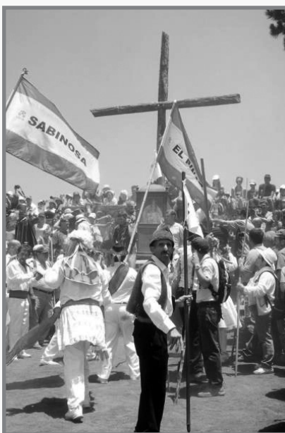
Pellegrini u zeffiena jilqghu lill-istatwa

Fis-sena 1643 ngħatat it-titlu ta' "Patruna ta' El Hierro", però kellha tkun is-sena 1740 li ziedet id-devozzjoni lejn Il-Verġni tat-Tliet Slaten. Dan għaliex billi kien hemm nixfa kbira minhabba nuqqas ta' xita, l-Herreni marru jitolbuha tidhol għalihom quddiem Binha Ġesù. F'El Hierro m'hemmx xmajjar u l-blat vulkaniku ma jzommx ilma. Għalhekk talbuha u għamlu wegħda li jgōrruha mal-gzira kollha, jekk tgħinhom. Malli waslu quddiem is-santwarju bdiet niezla xita bil-qliel! Bħala att ta' radd il-ħajr bdiet it-tradizzjoni u l-Festa llum imsejha wkoll "La