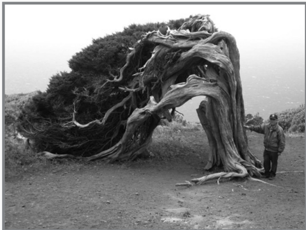
Waħda mill-bosta siġar tal-Ġniepru mgħawġa mill-irjieħ alisios

iehor jaqleb mill-orangjo għall-isfar, xhieda tal-kubrit! Xi ċaqleqqa tal-art ma tonqosx u mhux darba jew tnejn kellna nieqfu nneħħu l-ġebel minn nofs tat-triq. Madwarek muntanji, jew għoljiet b'ħofra f'nofshom li juru li kienu (u sa ċertu punt għadhom) koni vulkaniċi! Minn dawn hemm madwar tmien mija. Tassew xeni donnhom meħudin mid-Divina Comedia ta' Dante!