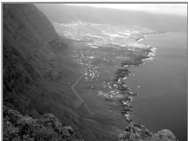
Dehra ta' El Golfo minn fuq l-irdumijiet weqfin

Irdumijiet weqfin li f'ħafna nħawi jilħqu l-elf metru biex jibqgħu neżlin dritt dritt għal ġol-baħar, xhieda tat-twelid vulkaniku tal-gżira. Tant hi għolja El Hierro li f'inqas minn nofs siegħa li toħroġ minn lukanda li l-"biħa" tagħha hi xatt il-baħar, tista' ssuq lejn Malpaso għolja iktar minn 1500 metru, u li għadha togħla! Tkun ħriġt bil-qmis u x-xorts, b'sema ċar fuqek u ssib ruħek 'il fuq mis-šhab bil-